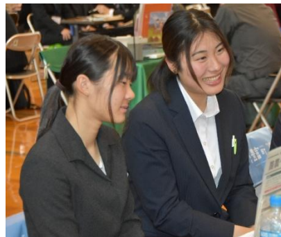
新たな出会いとつながり

六月二十七日から二日間の日程で農大祭が開催。一日目は体育祭が行われ、綱引きやサッカー、ロールころがしなどを通して交流を深めました。二日目は本祭が行われ、各学