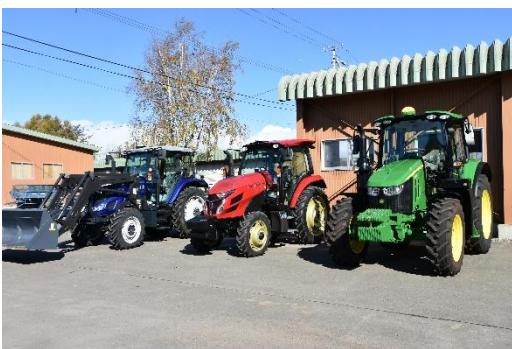
GPS付き自動操舵トラクタ

時代に即した教育の充実・強化に職員一同取り組んでまいりますので、同窓会の皆様におかれましても、変わらぬ御支援と御協力を賜りますようお願い申し上げます。