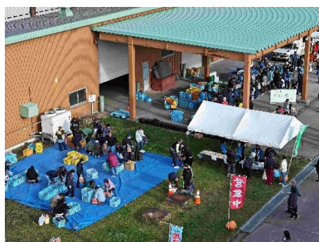
農大市の様子（ドローン撮影）