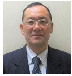
北海道立農業大学校