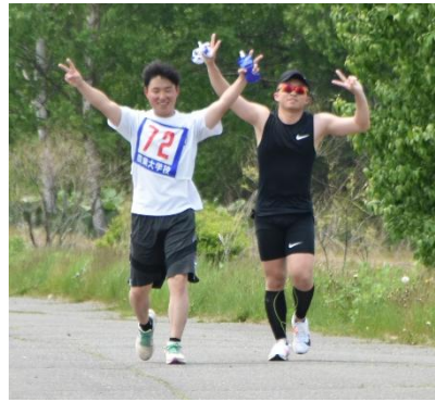
農業がつなぐ友情

農大春の恒例行事、強歩大会が五月三十日に行われました。当日の気温は夏日を記録。熱中症に気を付けながら、自分たちのペースで一步步前に進む姿が印象的でした。