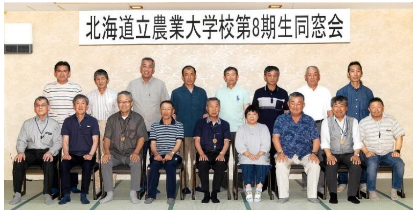
畑園第十二期同期会