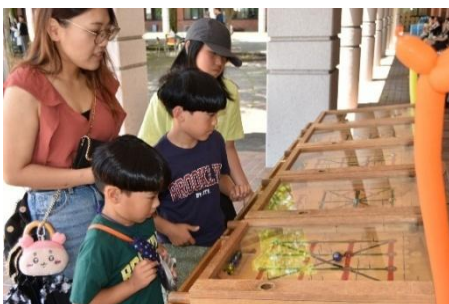
一球入魂〜クワガタを求めて〜