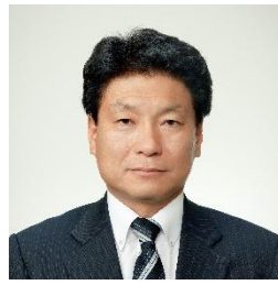
北海道立農業大学校同窓会